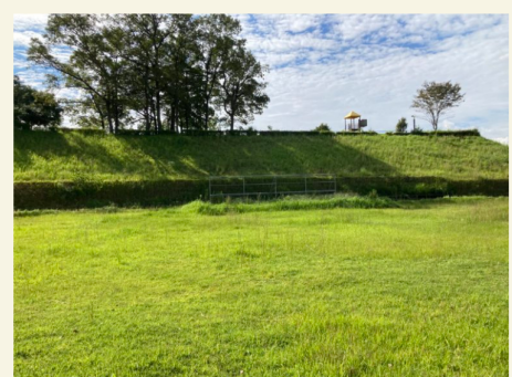
ピクニック広場のキッチンカー・物販エリア付近