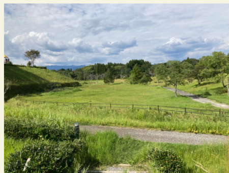
南側から撮影(手前の方がキッチンカー・物販エリア)